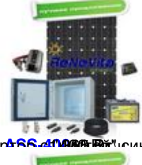
инвертор с 466.4000 Вт, синусоидой