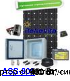
инвертор с 466.8000 Вт, синусоидой