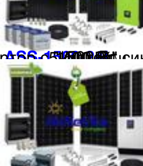
инвертор с 466.4000 Вт, синусоидой