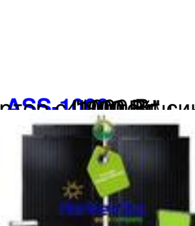
инвертор с 466.1000 Вт, синусоидой