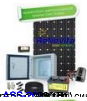
инвертор с 466.8000 Вт, синусоидой