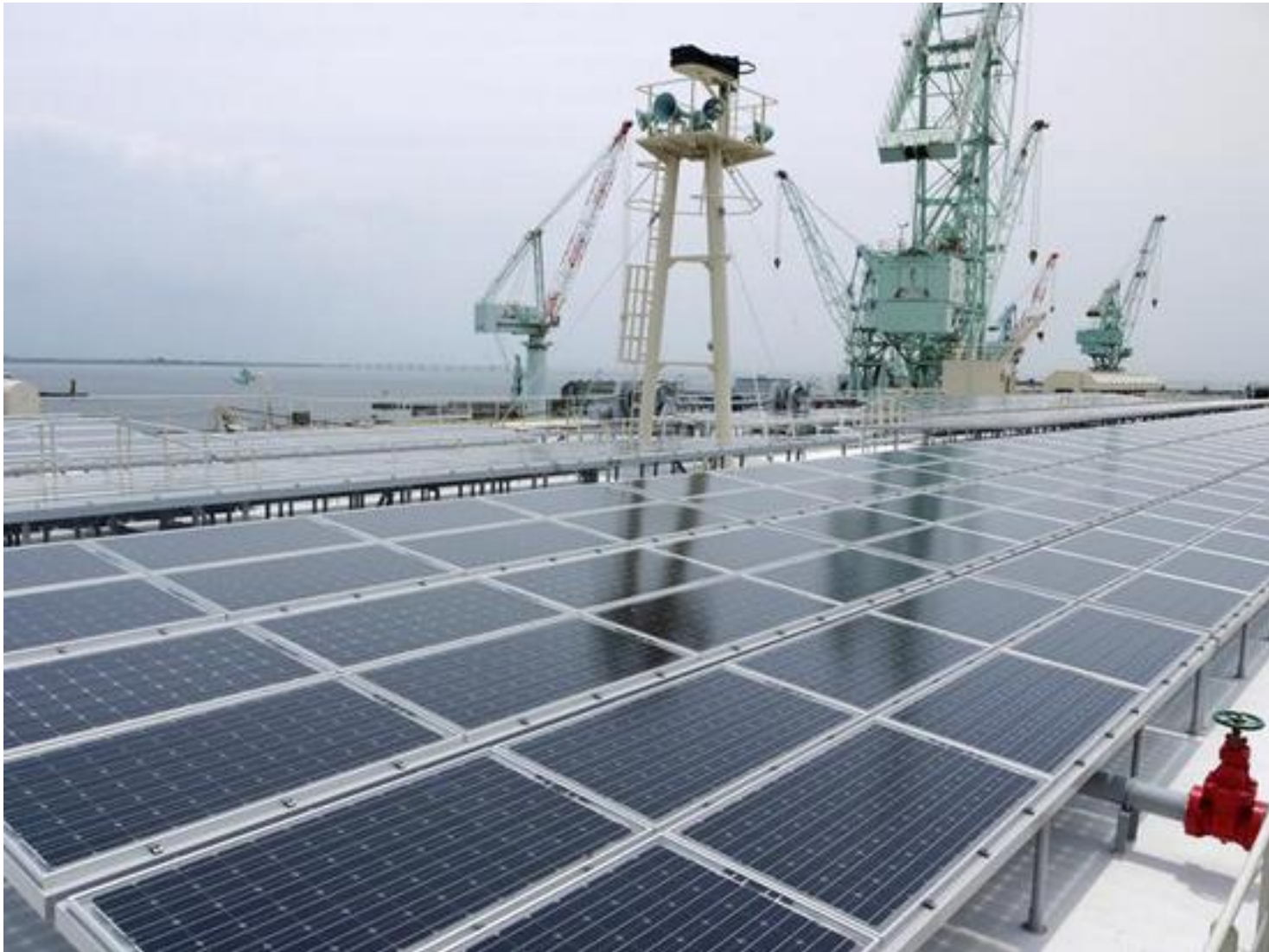
На судне Emerald Ace используется система Parabolic, позволяющая работать от электрической энергии